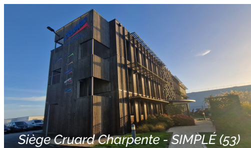
Siège Cruard Charpente - SIMPLÉ (53)